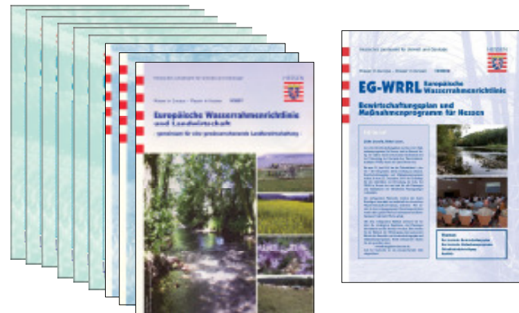
Faltblattreihe "Wasser in Europa – Wasser in Hessen"