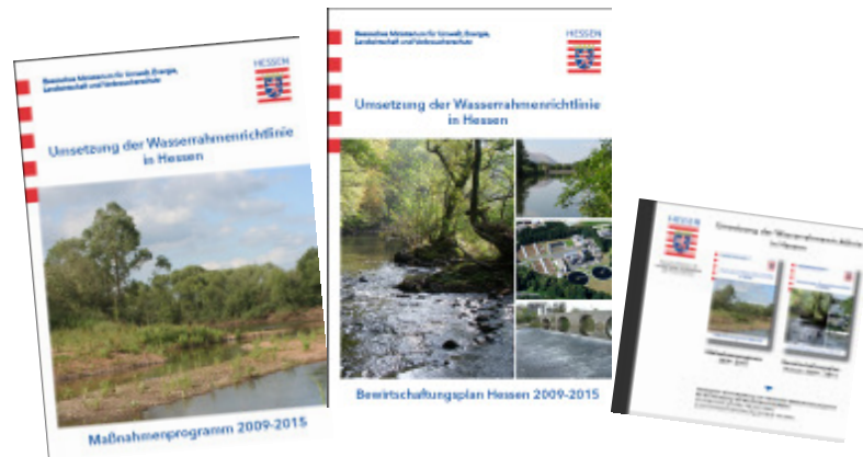
Maßnahmenprogramm und Bewirtschaftungsplan als Druckwerk und CD