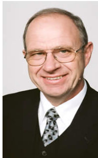
Wilhelm Dietzel Staatsminister

Ich freue mich, in einen regen Diskussionsprozess mit Ihnen einzutreten und lade Sie herzlich ein, am Wasserforum 2005 teilzunehmen.